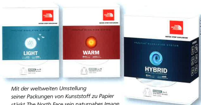
Mit der weltweiten Umstellung seiner Packungen von Kunststoff zu Papier stärkt The North Face sein naturnahes Image beim Verbraucher.

Manchmal muss der gesamte Packungslebenszyklus noch optimiert werden. Vor zwanzig Jahren stand zum Beispiel der Getränkekarton vor der Recyclingfrage. Er wies Vorteile gegenüber Einwegglasflaschen auf, konnte aber zunächst nicht recycelt werden. Inzwischen gibt es für diese Verbundpackungen umfassende Recyclingmethoden, und ihre Entwicklung für die neue Generation aus natürlichen Materialien ist in vollem Gange. Schwierig ist aber noch die Kommu-